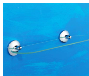
Ablagekonsole 600 mm Art.-Nr. 918.10 800 mm Art.-Nr. 919.10