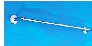
Badetuchhalter, 800 mm Art.-Nr. 908.10