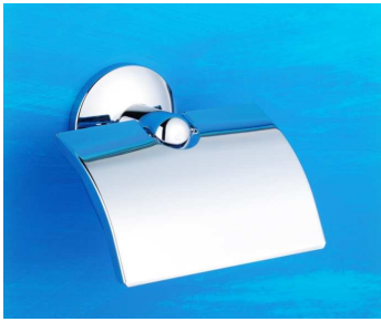
Papierrollenhalter mit Deckel Art.-Nr. 903.10