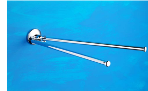
Handtuchhalter doppelt Art.-Nr. 910.10