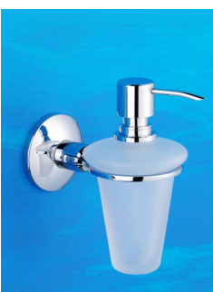
Seifenspender Art.-Nr. 905.10