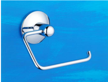
Papierrollenhalter ohne Deckel Art.-Nr. 902.10