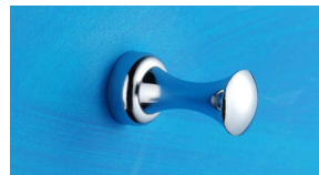
Handtuchhaken Art.-Nr. 950.10