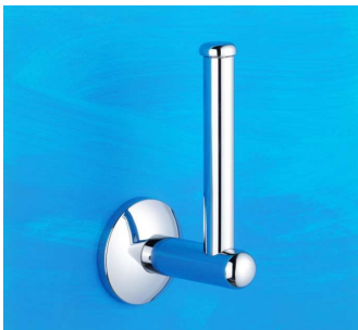
Reservepapierrollenhalter Art.-Nr. 900.10