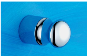
Handtuchhaken Art.-Nr. 914.10