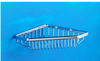
Eckseifenkorb, 165x165 mm Art.-Nr. 912.10