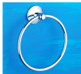
Handtuchring Art.-Nr. 901.10