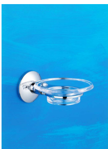
Seifenhalter mit Schale Art.-Nr. 907.10