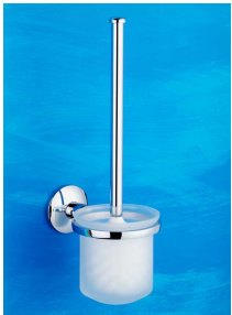
Toilettenbürstengarnitur Art.-Nr. 911.10