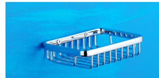
Seifenkorb 130 x 90 Art.-Nr. 920.10