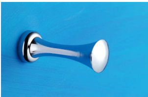
Bademantelhaken Art.-Nr. 913.10