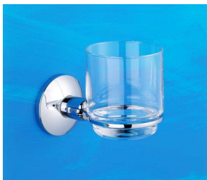
Glashalter komplett Art.-Nr. 904.10