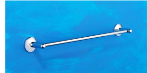
Badetuchhalter 600 mm Art.-Nr. 908.10