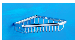
Eckseifenkorb, 120x120 mm Art.-Nr. 916.10